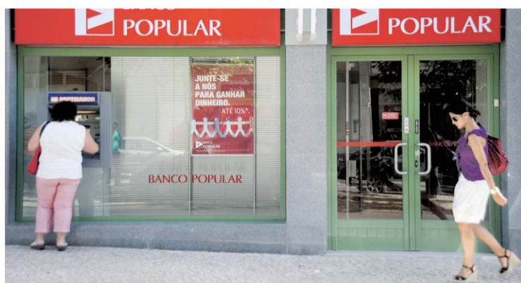
Banco Popular é dos que remunera melhor os depósitos

Na opinião da MoneyGPS, o BCE não deverá voltar a mexer nas taxas tão cedo e provavelmente o próximo movimento será de subida. Mas essa subida só deverá acontecer daqui a vários meses, apenas após a economia demonstrar sinais de crescimento e a inflação voltar a ser uma preocupação para o BCE.