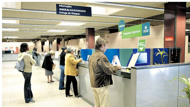
O prazo ideal de um depósito será de um ano

No entanto, com a aproximação do final do ano, devido à preocupa-