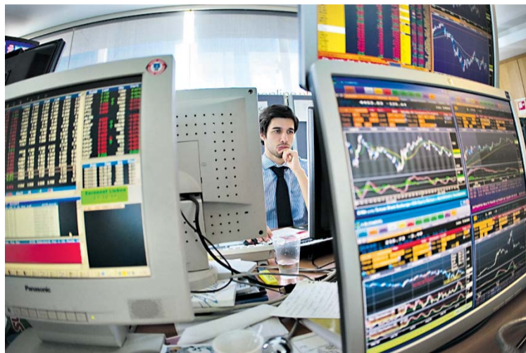
A Bolsa portuguesa já subiu 46% desde os mínimos de Março

É também importante reter que o valor das acções é normalmente analisado em termos do seu PER (Preço/Resultados Líquidos por ac-